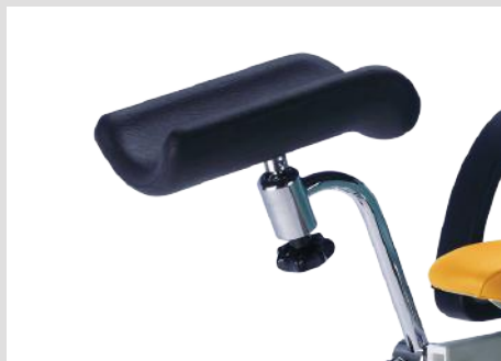
Подколенники по Гопелю