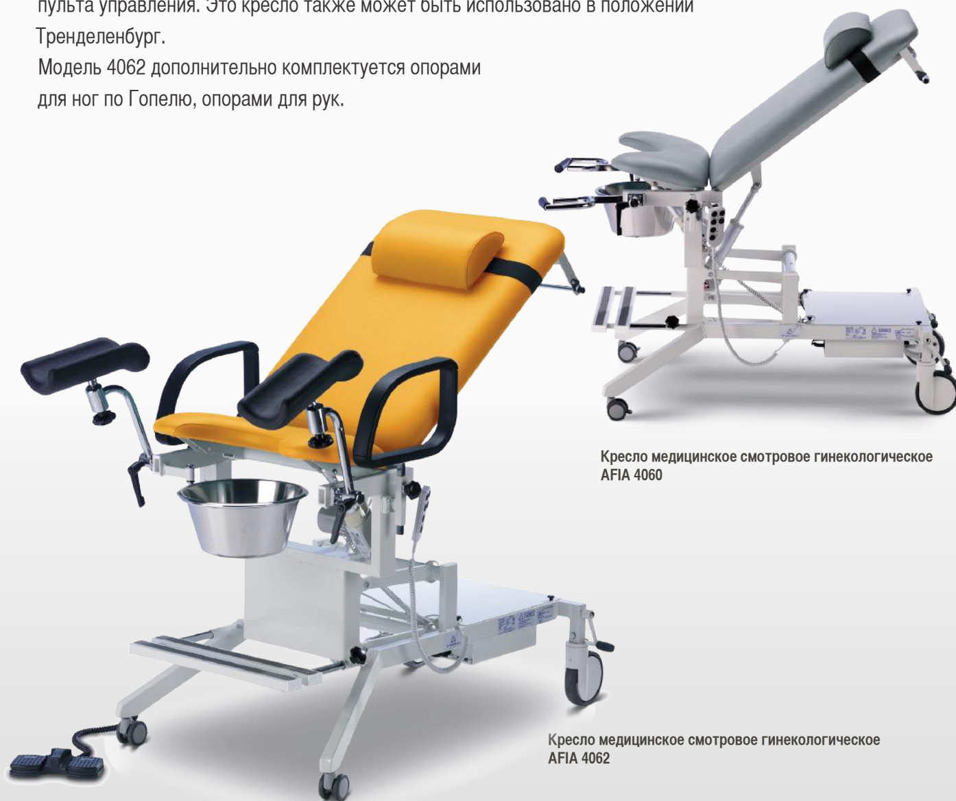
Кресло медицинское смотровое гинекологическое AFIA 4060

”Выбор профессионалов – удобное кресло, созданное для каждодневного использования”