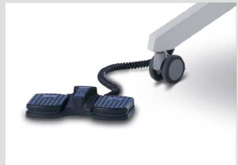
Ножной пульт управления