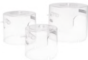
YZ – 130/160/200

Данное оборудование повышает эффективность лечения при поражениях головного мозга, выраженных изменениях метаболизма, нарушениях легочного кровотока, а также лечении дыхательной недостаточности у детей с первых месяцев жизни.