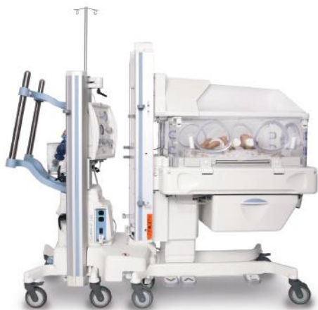
YP-3100B David, Китай