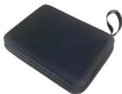
Чехол для переноски Overtone 6000