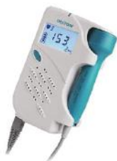
Датчик на 3 и 8 МГц (опция)