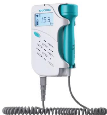
Overtone 6000-05/Overtone 6000-02