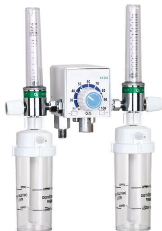
КУ 20 В