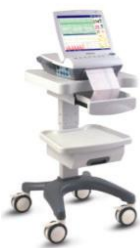
Стойка для Overtone 6900