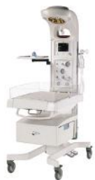
Panda iRes Warmer