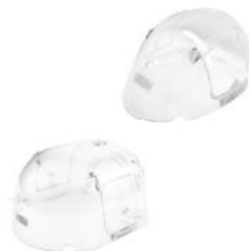
YZ – 260/300