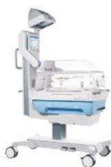
Babyleo TN500 Dräger, Германия

Уникальные системы, сочетающие в себе функционал как инкубатора, так и открытой реанимационной системы. Незаменимое оборудование для выхаживания новорожденных с экстремально низкой массой тела.