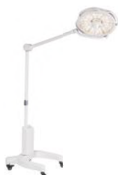
Convelar 1607 LED