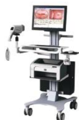
KN-2200A на штативе-тележке

Недорогой, простой в использовании кольпоскоп для периодического скрининга в гинекологических кабинетах. Легкий и понятный в эксплуатации.