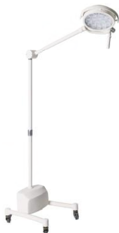
Convelar 1605 LED