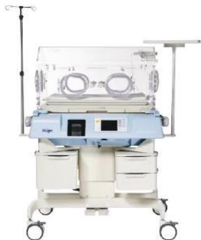
Isolette 8000 plus