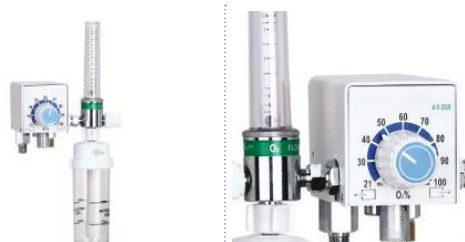
КУ 10 В

Удобный в использовании кислородный смеситель для открытых реанимационных систем.