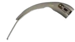
Клинка из металла