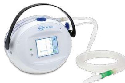
C 051 Thorax