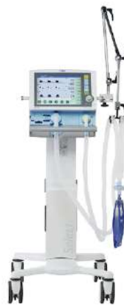
Savina 300 Select