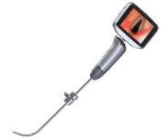
Видеоларингоскоп iS3-RP (педиатрический)