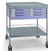
Тележки специального назначения