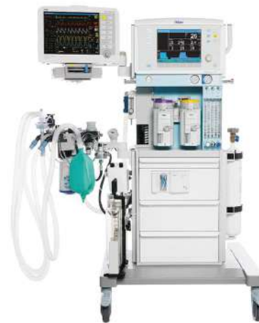
Fabius Plus XL

Fabius plus XL сочетает надежность немецкого качества с высокоэффективными режимами вентиляции. Концепция аппарата дает возможность подобрать качественную, необходимую сегодня версию рабочей станции, с расчетом на будущие потребности.