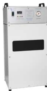
KC M02-10 TR