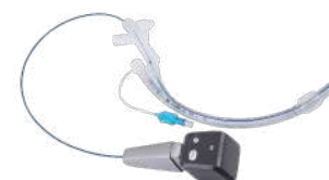
Видеоэндоскопы Insighters для двухпросветных трубок и неонатальные