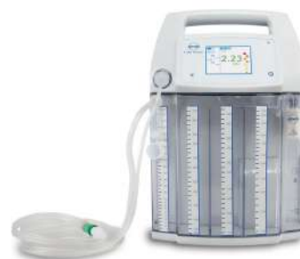
S 201 Thorax

Обеспечивают максимально безопасный цифровой кардиоторакальный дренаж. Предназначены для пациентов с пневмотораксом и плевральным выпотом, после хирургических вмешательств в торакальной хирургии и кардиохирургии, а также пульмонологии.