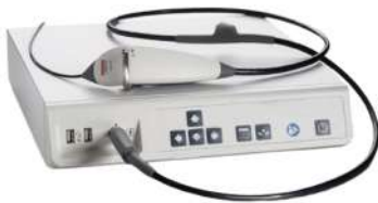
Видеопроцессор Pentax VIVIDEO CP-1000