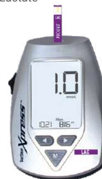
StatStrip Xpress Lactate