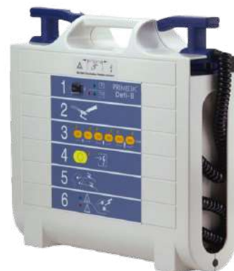
Primedic Defi B