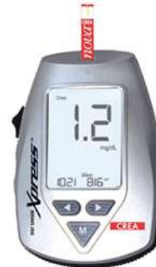
StatSensor Xpres Creatinine