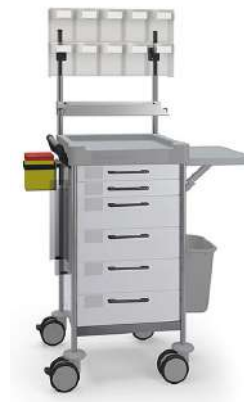
Тележки для медикаментов

Модульная конструкция позволяет подобрать оптимальный вариант тележки для эффективного технического использования в любом отделении медицинского учреждения.