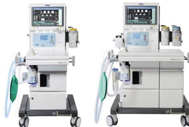
Atlan A350 / A350 XL

Atlan — это универсальный наркозный аппарат для любых пациентов, процедур и помещений. Аппарат настраивается под конкретные потребности клиницистов, а также оказывает большую помощь в быстром принятии обоснованных решений.