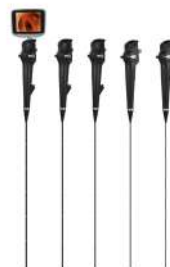
Гибкие видеоэндоскопы Insighters