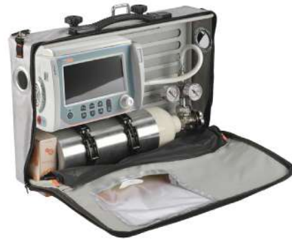
Oxivent Oxi4 Plus

Универсальное решение в респираторной поддержке в стационарных условиях и транспорте у всех возрастных групп пациентов, в том числе у недоношенных детей с экстремальной низкой массой тела.