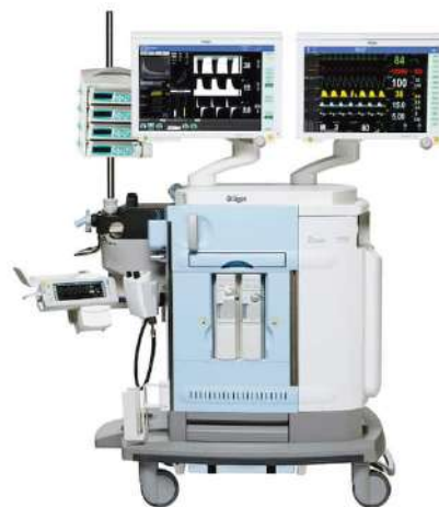
Zeus Infinity Empowered

Функции защитной вентиляции легких, экономичная технология подачи газа, инструменты поддержки принятия решений и комплексный мониторинг. Аппарат Zeus IE позволяет улучшить клинические результаты, эффективность рабочего процесса и снизить затраты на протяжении всего процесса наркоза.