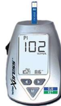
StatStrip Xpress Glucose/Ketone