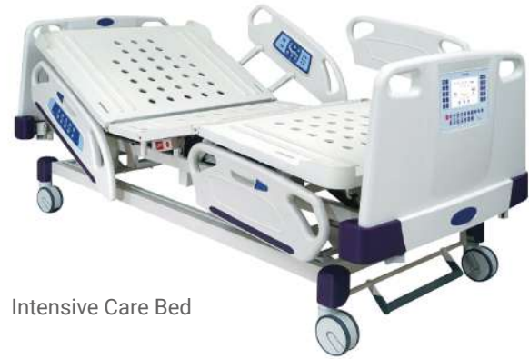
Intensive Care Bed

Функциональные кровати обеспечивают максимальный уровень безопасности и комфорта для каждого пациента. Простое управление облегчает работу медицинского персонала.