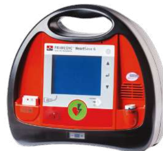
Primedic HeartSave 6