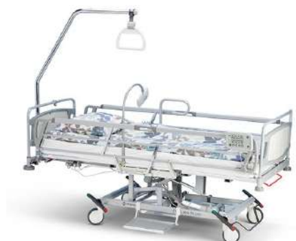
Merivaara Futura Plus