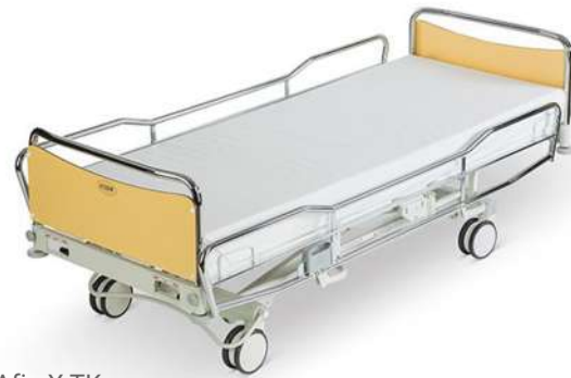
ScanAfia X TK

Медицинские кровати высокого качества — беспримысленный выбор для больничных палат. Предназначены для использования профессиональными медицинскими работниками в больницах, медицинских центрах и других медицинских учреждениях.