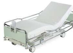
ScanAfia X ICU