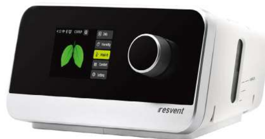
iBreeze CPAP/ BiPAP device

Умный, тихий, удобный аппарат для использования в составе комплексного лечения дыхательной недостаточности легкой степени тяжести, легкой или тяжелой форм обструктивного апноэ сна, хронической обструктивной болезни легких, различных нейромышечных заболеваний и других заболеваний, требующих аппаратной дыхательной поддержки.