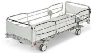
ScanAfia X ICU W