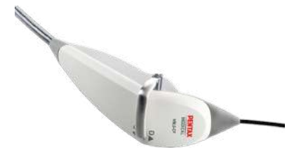
Видеоназофаринголарингоскоп Pentax VNL9-C