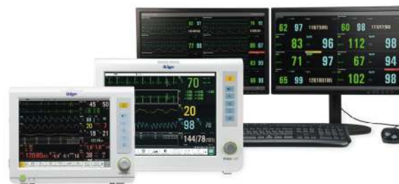
Система центрального мониторинга Vista 120

Мониторы серии Vista 120 и Vista 120 S разработаны для решения клинических задач в рамках имеющегося бюджета, позволяя обеспечивать эффективный и высококачественный уход за пациентами.