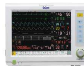
Vista 120 S