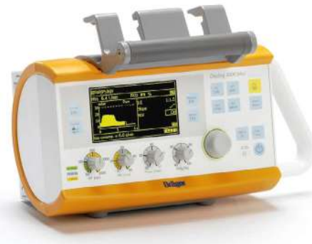
Oxylog 3000 Plus

Новый уровень искусственной вентиляции при транспортировке больных. Обладая такими высокоэффективными функциями, как AutoFlow, встроенная капнография и неинвазивная вентиляция, компактный и мощный аппарат Oxylog 3000 plus позволяет оказывать помощь пациентам при их транспортировке, получая информацию об эффективности вентиляции.