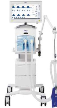
Evita V600 и Evita V800

Аппараты ИВЛ Evita V600 и Evita V800 сочетают в себе высокоэффективную вентиляцию с эстетичным дизайном, обеспечивающим быструю и безопасную работу на каждом этапе.