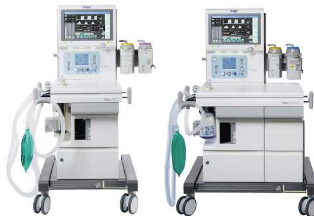
Atlan A300 / A300 XL

Полный набор клинических характеристик и проверенное качество вентиляции делают Atlan идеальным наркозным аппаратом для любых пациентов и любых хирургических процедур. Конструкция платформы обеспечивает максимальную гибкость для большинства вариантов пространственной компоновки.