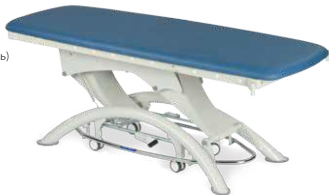
Смотровой стол Capre E1