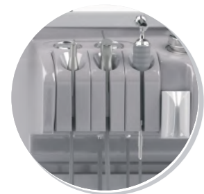
АСПИРАТОР, ПИСТОЛЕТ ДЛЯ ПРОМЫВАНИЯ УХА, РУКОЯТКА РАСПЫЛИТЕЛЕЙ