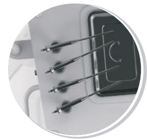
РАСПЫЛИТЕЛИ ЛЕКАРСТВЕННЫХ СРЕДСТВ