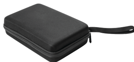
Сумка для Овертон 6000