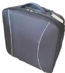
Сумка для Овертон 6900