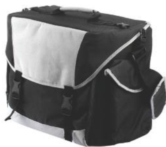
Сумка для Овертон 6200