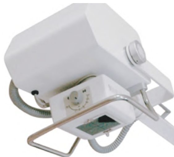
Вращающийся коллиматор со световым центратором

Расширенная комплектация палатного аппарата Dixon Remodix 9507 включает в себя стойку для флюорографии и стол для исследований в положении лежа. Такая полностью мобильная система не требует дорогостоящего монтажа. Она позволяет организовать службу общей рентгенографии или массовый профилактический осмотр в любом месте. Вы сможете быстро возобновить работу рентгенкабинета в случае переезда в другое помещение.