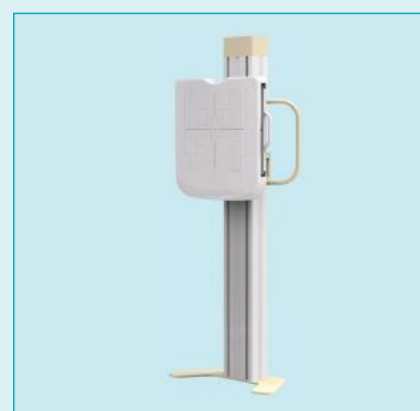
Вертикальная стойка снимков