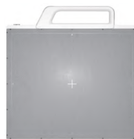
Цифровой плоскочувствительный детектор