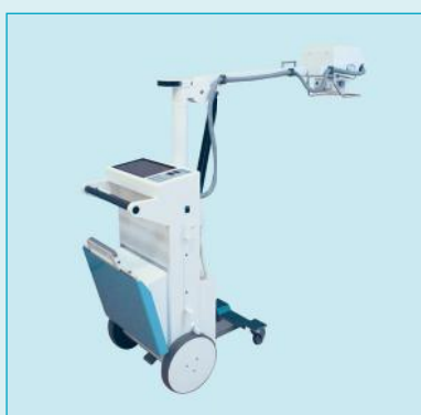
Цифровой рентгеновский аппарат Dixon Remodix 9507