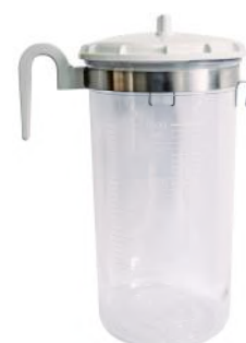
Накопитель 4000 мл.