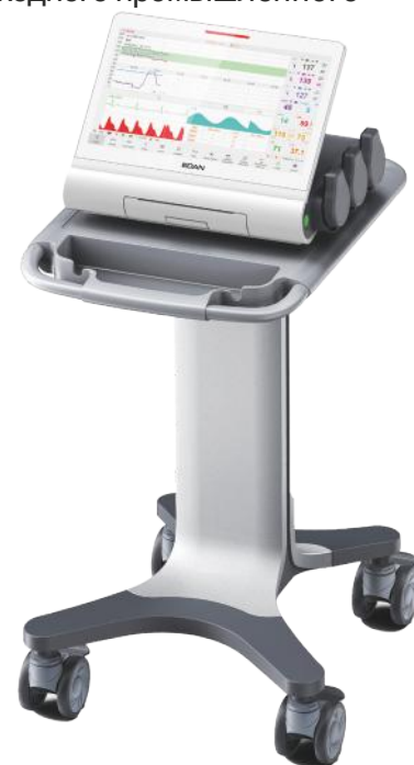
Стойка для F15/F15 Air