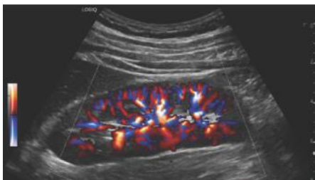
Radiantflou, почка, C1-6-D