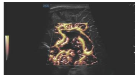
MVI и Radiantflou, головной мозг новорожденного, L2-9-D