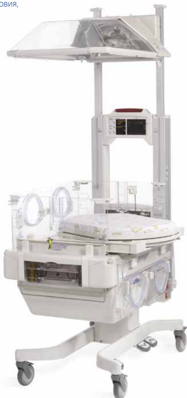
Реанимационная система для новорожденных Giraffe Omnibed