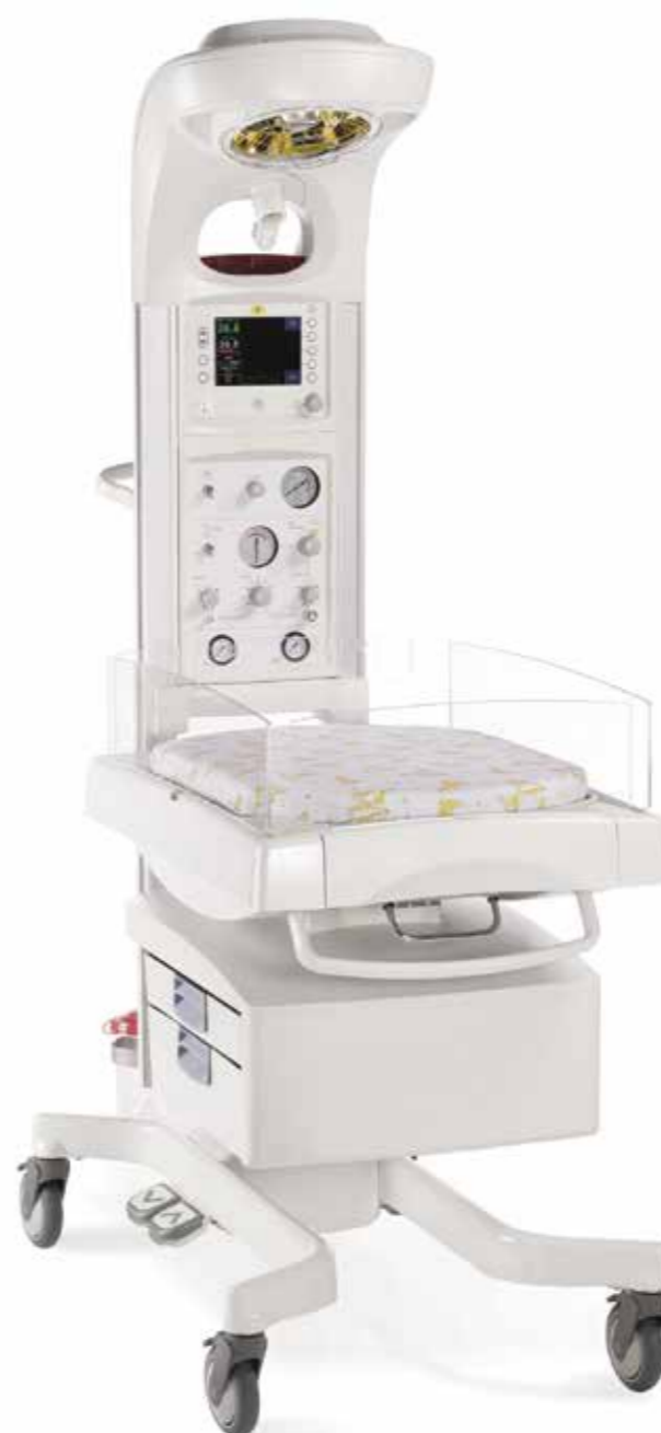
Комплекс реанимационный открытый Giraffe