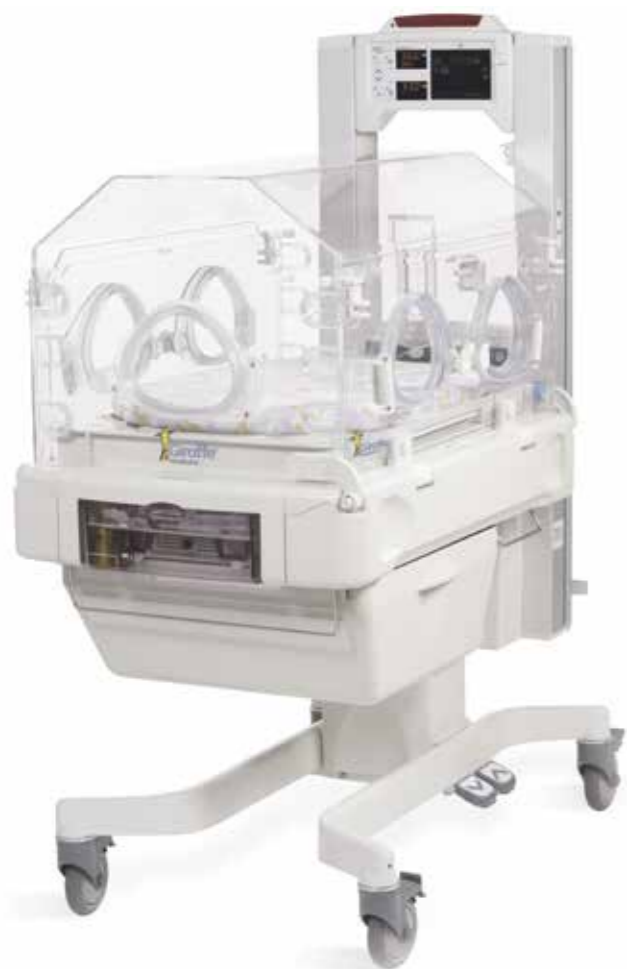
Инкубатор интенсивной терапии для новорожденных Giraffe INC

Реанимационные системы семейства Giraffe упрощают и стандартизируют медицинскую помощь, а также помогают достичь положительных конечных исходов при выхаживании больных детей, учитывая при этом потребности медперсонала и членов семьи.