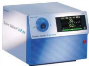
Medilas H Uropulse

Компактная система идеальна для установки на эндоскопические стойки, потолочные консоли или тележки; мощность лазера 20 Вт.