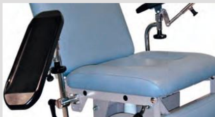
Опоры для рук для взятия крови