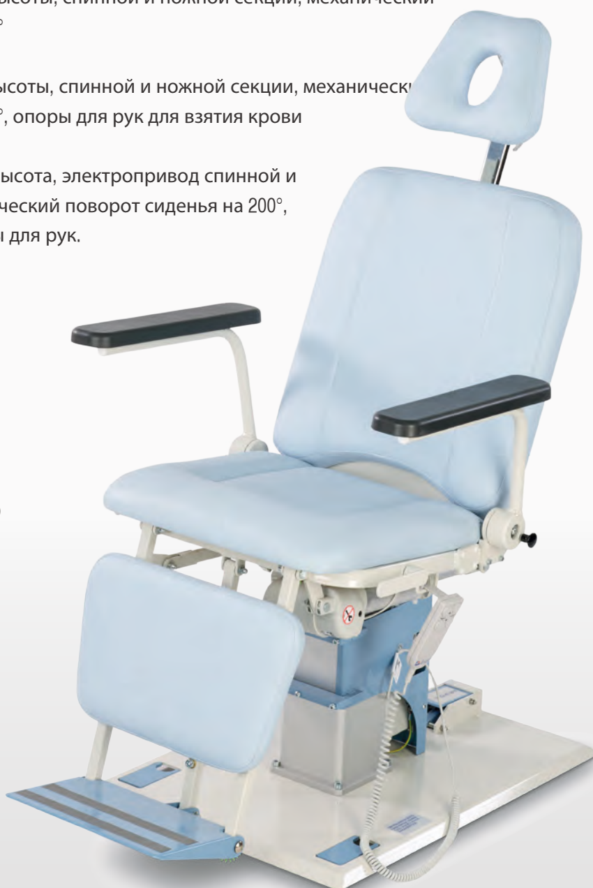
Кресло медицинское смотровое Lojer 6900 (для ЛОР исследований)

6920 - Фиксированная высота, электропривод спинной и ножной секции, механический поворот сиденья на 200°, откидывающиеся опоры для рук.