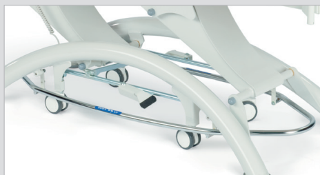
Педаль 360° в виде рамы по периметру стола, для регулировки высоты