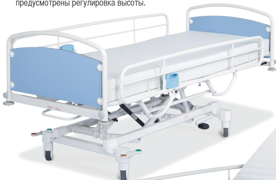
Кровать гидравлическая Salli H - 2 секции

“Простое и функциональное решение для ЛПУ”