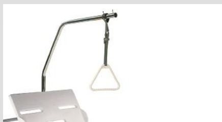
Дуга для активации пациента