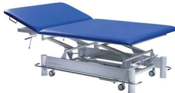
Manumed Special Exercise

Профессиональный стол для кинезотерапии и занятий ЛФК для медицинских центров, клиник, госпиталей, врачебно-физкультурных диспансеров и реабилитационных центров. Столы сконструированы таким образом, чтобы во время выполнения упражнений терапевт мог находиться рядом с пациентом.