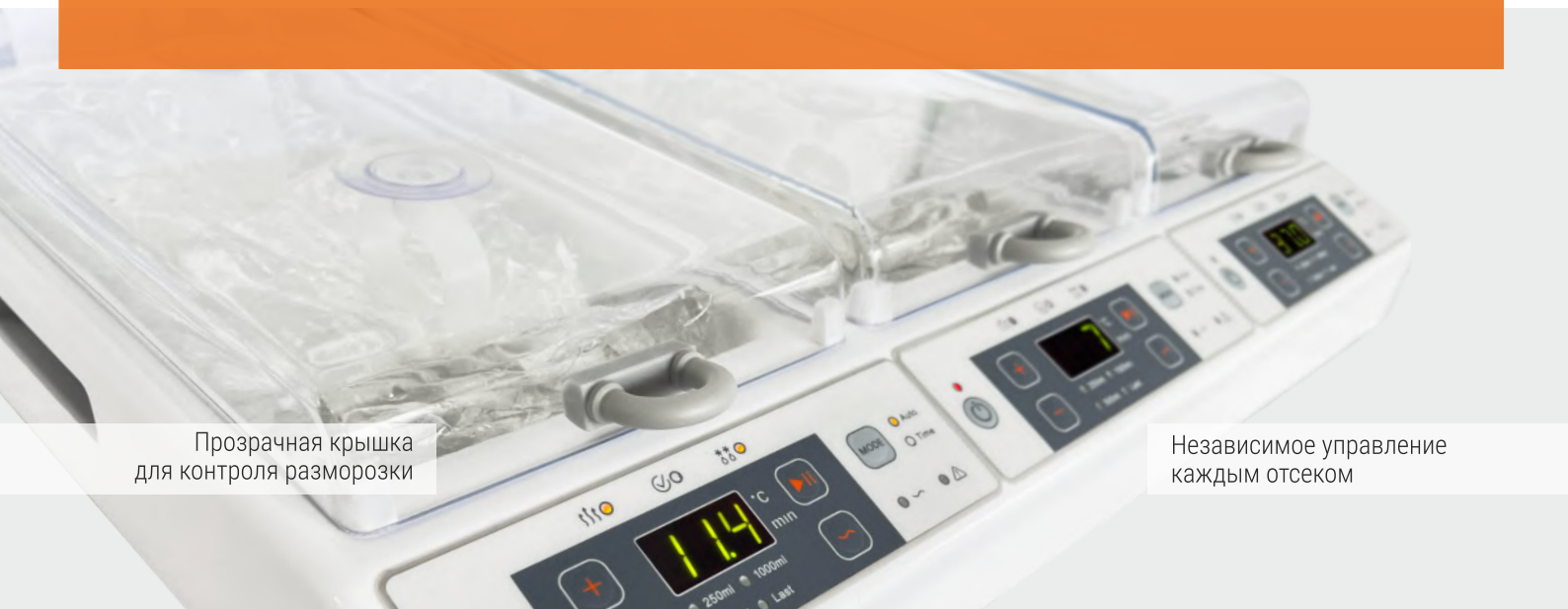
Прозрачная крышка для контроля разморозки

Для более интенсивного равномерного оттаивания используется режим бережного перемешивания - специальные кольца механически воздействуют на пакеты с плазмой, обеспечивая волнообразные движения.