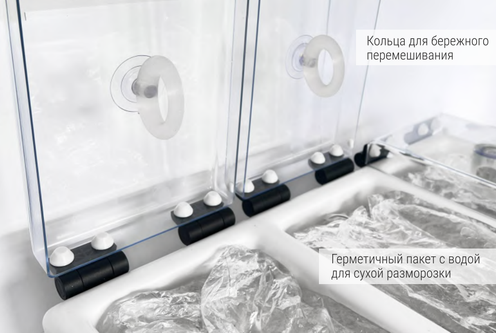
Кольца для бережного перемешивания