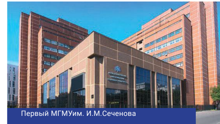
Первый МГМУ им. И.М.Сеченова