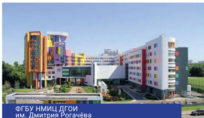
ФГБУ НМИЦ ДГОИ им. Дмитрия Рогачёва