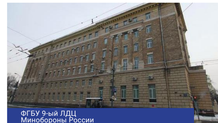
ФГБУ 9-ый ЛДЦ Минобороны России