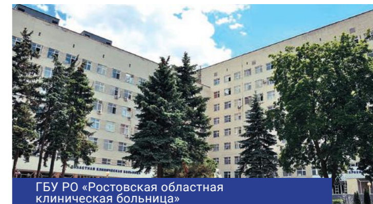
ГБУ РО «Ростовская областная клиническая больница»