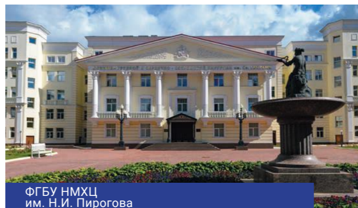
ФГБУ НМХЦ им. Н.И. Пирогова