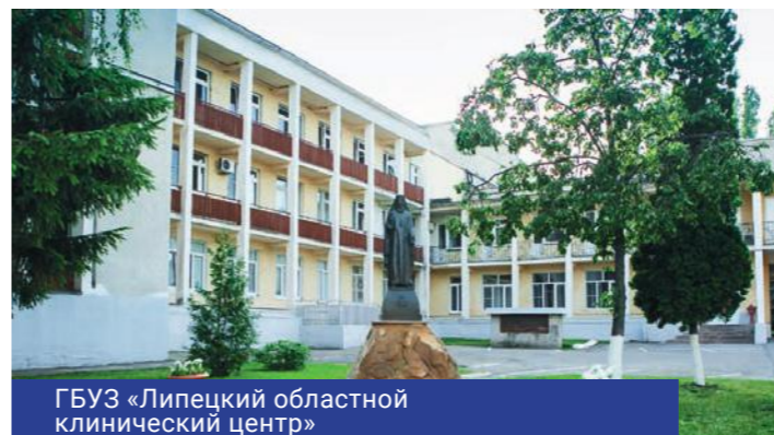
ГБУЗ «Липецкий областной клинический центр»