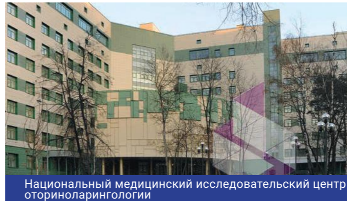
Национальный медицинский исследовательский центр оториноларингологии