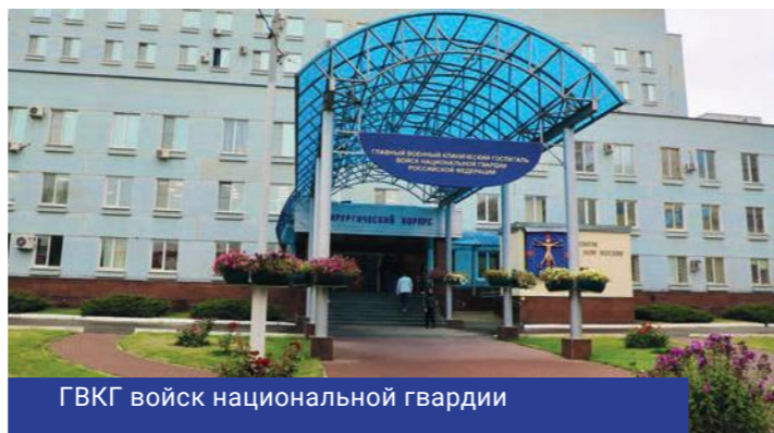
ГВКГ войск национальной гвардии