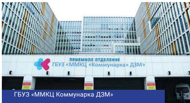
ГБУЗ «ММКЦ Коммунарка ДЗМ»