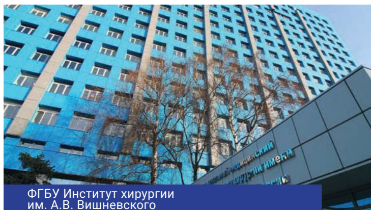
ФГБУ Институт хирургии им. А.В. Вишневского