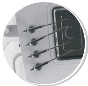
РАСПЫЛИТЕЛИ ЛЕКАРСТВЕННЫХ СРЕДСТВ