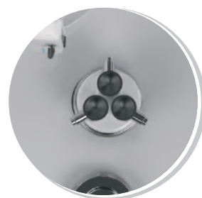
СБРОС ОТХОДОВ И ИСПОЛЬЗОВАННОГО ИНСТРУМЕНТА