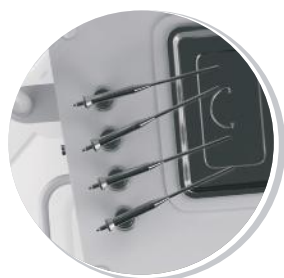
РАСПЫЛИТЕЛИ ЛЕКАРСТВЕННЫХ СРЕДСТВ