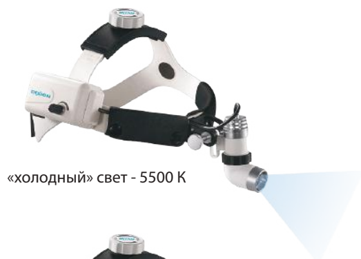
«холодный» свет - 5500 K