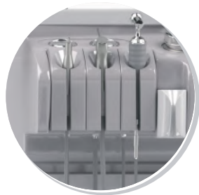
АСПИРАТОР, ПИСТОЛЕТ ДЛЯ ПРОМЫВАНИЯ УХА, РУКОЯТКА РАСПЫЛИТЕЛЕЙ