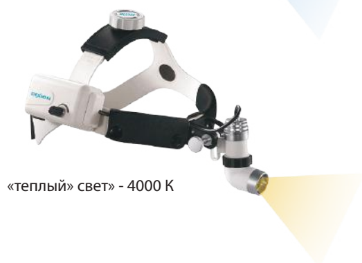
«теплый» свет» - 4000 K

Сфокусированный луч налобного осветителя Dixon LED позволяет врачу увидеть реальную картину состояния тканей, не искаженную рассеянным светом.