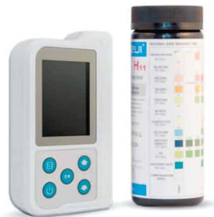
Рис. 1. Портативный анализатор мочи «ЭТТА АМП-01» на тест-полосках

Проведено прямое сравнение двух анализаторов, работающих на тест-полосках (табл. 1). Считывание результатов у обоих производилось по принципу отражательной фотометрии. Удельный вес мочи в аппарате «Arkray» определялся посредством рефрактометрии. Отличительной особенностью аппарата «ЭТТА АМП-01» является его малый вес, что в том числе, определяет возможность его использования в домашних условиях.